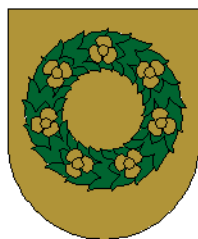
TALSU RAJONA PADOME